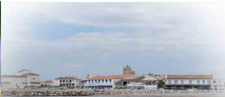
南フランスオーガニックはちみつセット 海の養蜂家のはちみつ