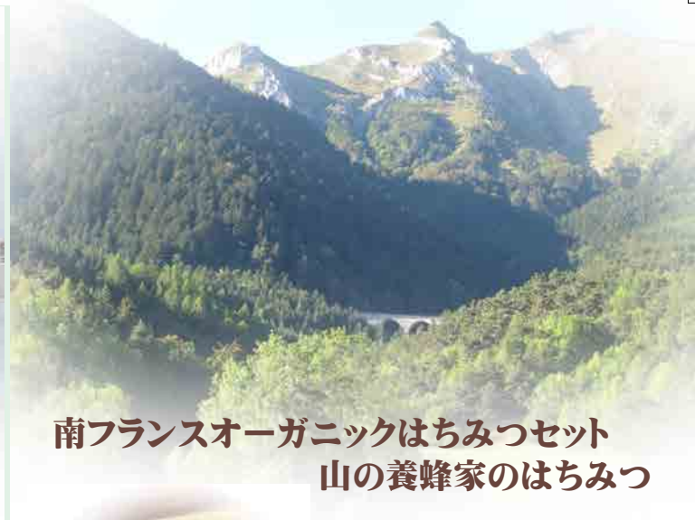
南フランスオーガニックはちみつセット 山の養蜂家のはちみつ